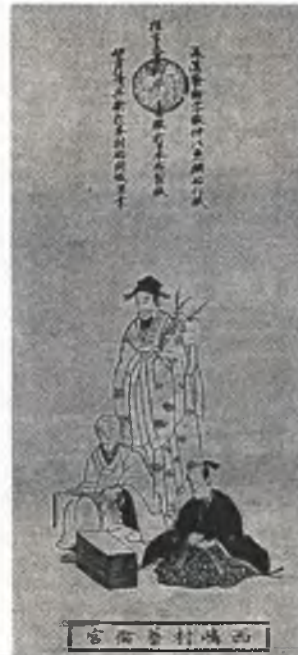
105 йилда Хитойда қоғозни ихтиро қилган Цай Луннинг ҳаёлий портрети

Ўша даврда Бухорода Куръоннинг ягона уч-тўрт нусхаси мавжуд бўлиб, XVI аср Мир-