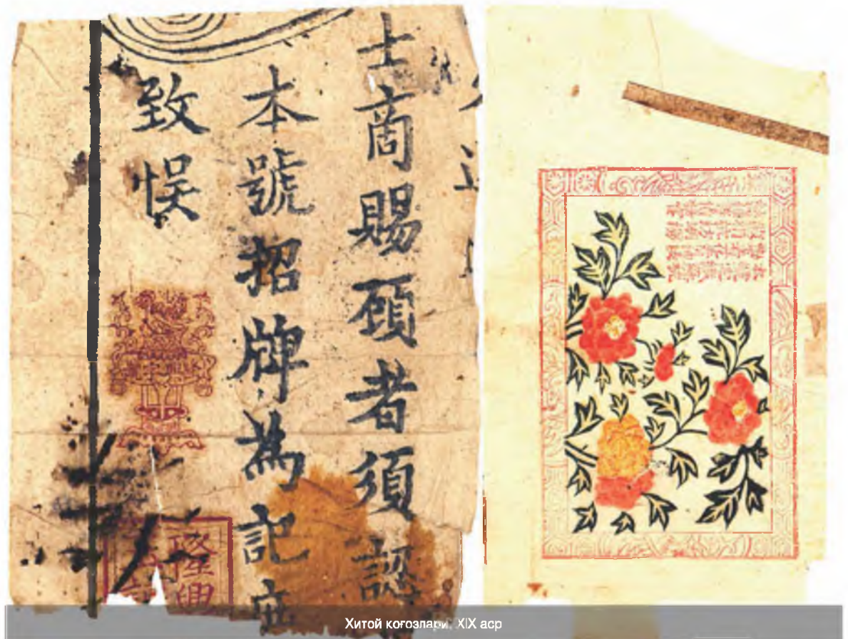
Хитой қоғозлари, XIX аср

Биринчи тури – ипак толалардан тайёрланган ва ҳеч қандай пахта аралашмаган. Бу қоғоз ўта сифатли, пишиқ, юзаси жуда силлиқ новвот рангда. Ушлаганда ёқимли бўлиб, «ипак» деб аталган.