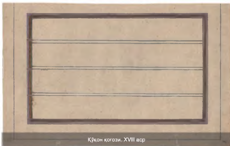
Қўқон қоғози. XVIII аср

XVIII асрда ҳукмронлик қилган Аштархонийлардан бўлган Абдулазизхон даврида (1645–1680) юксак сифатли Самарқанд қоғози жуда қадрланган. Ўша даврдан бизгача етиб келган қўлёзмалар, қоғозларининг яхши ишланганлиги буни тўлиқ тасдиқлайди. Улар қалинрок, сарғимтир, ушлаганда ёқимли, ях-