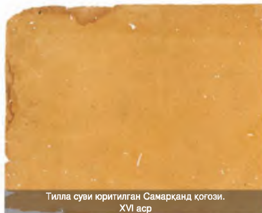
Тилла суви юритилган Самарқанд қоғози. XVI аср