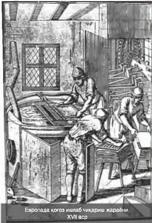
Европада қоғоз ишлаб чиқариш жараёни. XVII аср

ши ялтиратилган. XVI ҳамда ундан кейинги асрлардаги вақф ҳужжатлари ҳам буни тасдиқлайди. Рус археологларидан бирининг ёзишича, Сиёб дарёсининг куйироғида, унга Оби Машҳад ирмоғи келиб тушадиган ерида шаҳзода Абдуллахон ариғининг кўприги жойлашган. Бу кўприкдан юқори ва пастда Сиёб дарёсидан тарқаладиган ариқлар бўйлаб жуда кўп қоғоз тегирмонлар жойлашган. Тегирмонлар ҳужжатларда айтилишича, ёғочдан, тошлардан ва темирлардан қурилган. Бу жой Самарқандда қоғоз тегирмонлари бўлган ягона жой бўлиши ҳам мумкин.