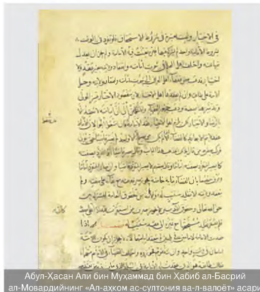
Абул-Ҳасан Али бин Муҳаммад бин Ҳабиб ал-Басрий ал-Мовардийнинг «Ал-аҳком ас-султония ва-л-валоёт» асари

Галдаги ишларимиз: Жаҳон хотираси дастурининг мақсади ва моҳиятини кенг жамоатчилик ва илм аҳлига тушунтириш ҳамда шу орқали ватанимизда сақланаётган қадимий китоблар ҳақида нафақат юртимиз аҳолиси, балки дунё аҳолиси фойдаланишга эга бўлиши, мамлакатнинг нодир, ноёб ва алоҳида қимматга эга нашрларнинг ягона рўйхатини, бир сўз билан айтганда, ягона каталогини яратишимиз лозимлигини кўрсатади. Ўзбекистон Республикаси Президентининг 2017 йил 23 июндаги ПҚ-3080-сон қарори, Вазирлар Маҳкамасининг 2017 йил 10 мартда тасдиқланган 08/1-73-сон «Китоб маҳсулотларини чоп этиш ва тарқатиш тизимини ривожлантириш, китоб мутолааси ва китобхонлик маданиятини ошириш ҳамда тарғибот қилиш бўйича Комплекс чора-тадбирлар дастури»даги белгиланган вазифаларни бажариш, миллий-маданий меросимизни асраб-авайлаш, миллат мулкига айланган нодир нашрлар, кўлёмалар ва графикага оид ҳужжатлар, манускриптларнинг ягона реестри ва маълумотлар базасини тизимли юритиш, ахборот-кутубхона марказлари нодир фондлари мониторингини ўтказиш масалаларини тартибга солиш каби кечиктириб бўлмайдиган ишлар турибди.