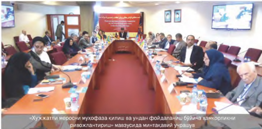
«Хужжатли меросни муҳофаза қилиш ва ундан фойдаланиш бўйича ҳамкорликни ривожлантириш» мавзусида минтақавий учрашув

бундай стандартлар рўйхати ЮНЕСКОнинг баёни билан тасдиқланиши;