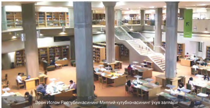
Эрон Ислом Республикасининг Миллий кутубхонасининг ўқув заллари

- кенг жамоатчиликка дастур ва унинг асарларини тарғиб қилиш.